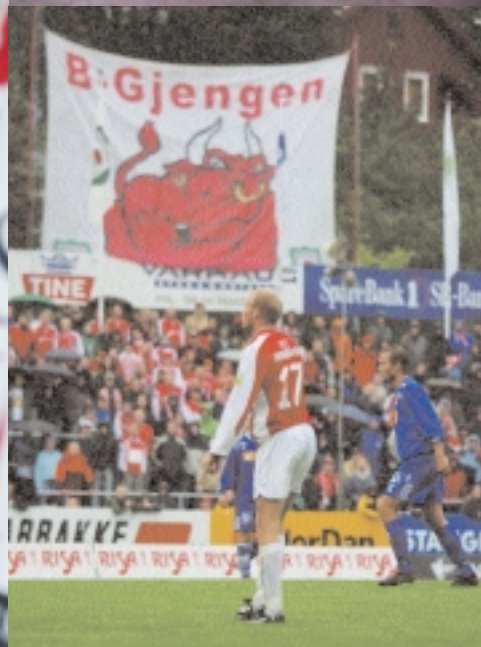
LENGST TIL VENSTRE: Spenning: Dette er ikke noe for svake hjerter. Spenningen periodevis tykt utenpå.